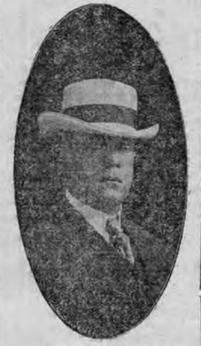
DR. CARLOS PUPO

El domicilio respectivo de las 192 mujeres es como sigue: de San José 177; de Cartago 5; de Alajuela 4; de Heredia 1; de Puntarenas 2; de Limón 2; y de Guanacaste, 1.